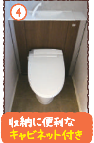
収納に便利な キャビネット付き