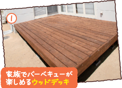
家族でバーベキューが 楽しめるウッドデッキ

【返済例】 ボーナス・頭金0円 月々84,709円 お支払い額 借入額3,280万円(35年返済) 都市銀行・紹介ローン変動金利0.47%