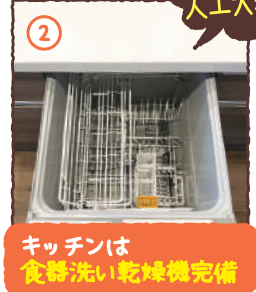
キッチンに 食器洗い乾燥機完備