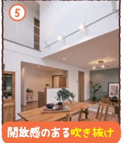
開放感のある吹き抜け

子育て世代にピッタリ 商業施設が充実! スーパーおくやま約500m ココカラファイン約800m ローソン約800m 田原本郵便局約1300m