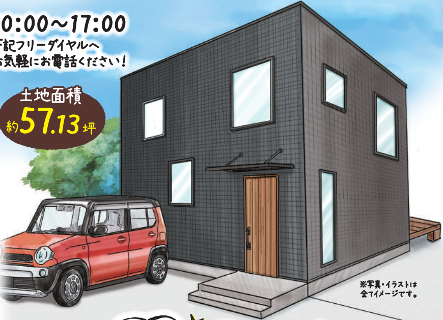
※写真・イラストは 全てイメージです。