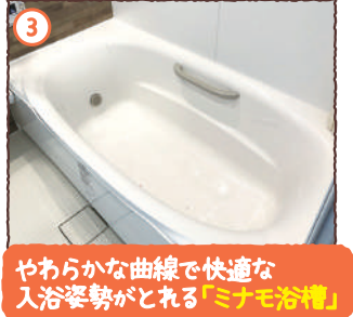
やわらかな曲線で快適な 入浴姿勢がとれる「ミナモ浴槽」