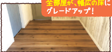
全部屋が、幅広の床に グレードアップ!