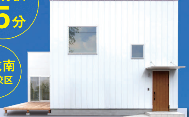
※建物イメージ・内観写真は参考プランです。