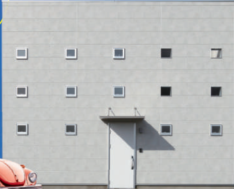
※建物イメージ・内観写真は参考プランです。