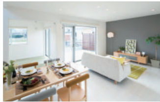
※掲載写真は全てイメージです。

一番人気のオプションプラン。和室やウッド デッキなど家族の楽しみ方が広がります!