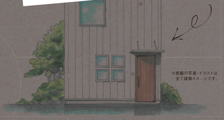
※掲載の写真・イラストは 全て建築イメージです。