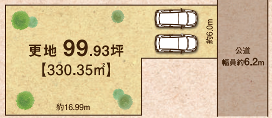
※掲載の写真・イラストは 全て建築イメージです。

■「三輪建築条件付土地」物件概要●交通/桜井線「三輪駅」4分●所在地/桜井市三輪●地目/宅地●土地権利/所有権●土地面積/面積330.35㎡(約99.93坪)●用途地域/近隣商業地域●建ぺい率/80%●容積率/300%●道路幅員/東側約6.2m●現況/更地●引渡日/相談●設備/電気・市営水道・公共下水道●その他法令上の制限/準防火地域●校区/三輪小学校・大三輪中学校●取引形態/売主 ■この土地は、土地売買契約後3ヶ月以内に、株式会社イースマイルと建物の建築請負契約を締結することを条件に販売します。■掲載物件が契約または売却済の場合はご容赦下さい。 ■掲載内容と現況が異なる場合は現況を優先させていただきます。広告有効期限/2022年3月末日