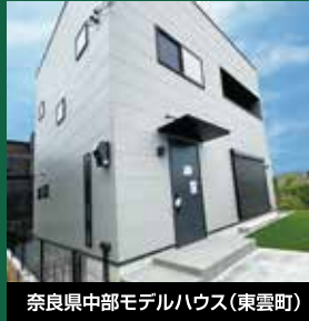
奈良県中部モデルハウス(東雲町)