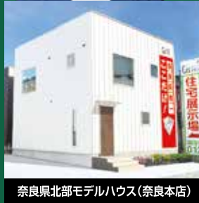
奈良県北部モデルハウス(奈良本店)