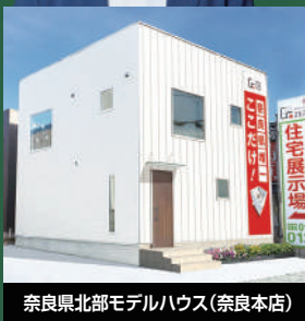
奈良県北部モデルハウス(奈良本店)