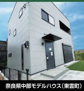
奈良県中部モデルハウス(東雲町)