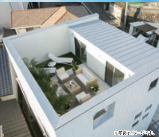
※写真はイメージです。