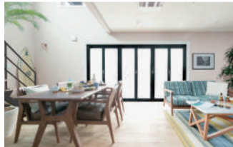
※掲載写真は全てイメージです。